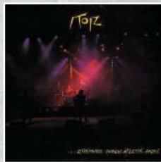
...EREMUKO DUNEN ATZETIK DABIL (1988)