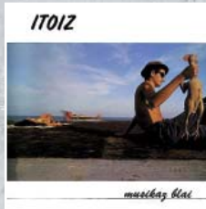
MUSIKAZ BLAI (1983)