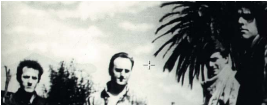
(...eremuko dunen atzetik dabil 1988)

However, when they were at their best, they started to question about their future. Itoiz had already many years and it was too much work to keep up the fame of Itoiz . In 1987 they recorded a live album in Getxo. They did not say it publicly, but the members of the band knew it would be the last concert. In the two concerts there were around six thousand people and they played songs from all the albums. They even play five new songs: the meaningful Non podo mais , Desolatio , Intro , Mendi buelta and Gangaran gara . That had quietened down the rumours about an hypothetical creative crisis of the band. Between the new songs only the first three were introduced in the album ...eremuko dunen atzetik dabil